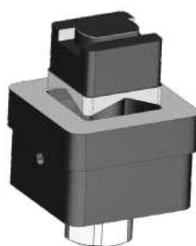
54C30 - 54C35