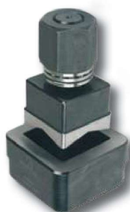
54C46 - 54C67 - 54C92