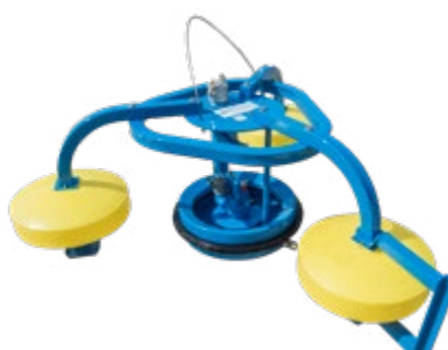
SeaSkater se šroubovým čerpadlem E150