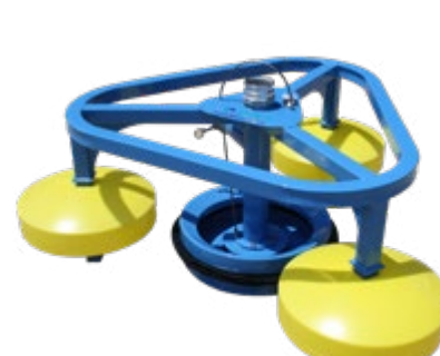
SeaSkater s Připojením externího odsávání