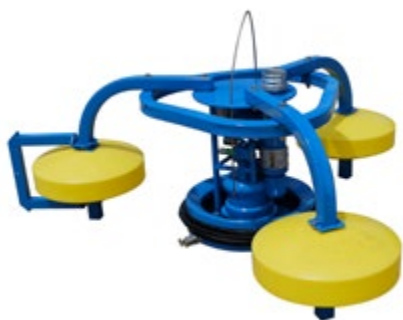
SeaSkater se šroubovým čerpadlem ES400

Tento skimmer může být vybaven naším šroubovým čerpadlem ES400, ponorným čerpadlem E150 nebo může být nastaven pro externí sací čerpadlo nebo vakuum (dodáváno samostatně).